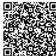
Fragebogen für Erwachsene

Bitte füllen Sie die Fragebögen bis zum 31. Mai aus. Falls Sie diese lieber in Papierform wünschen, kommen Sie bitte im Pfarr-