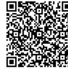
Fragebogen für Kinder