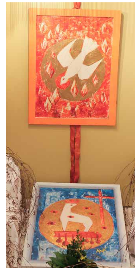
Aus dem Nachlass von Prälat Konstantin Kohler ist das Gemälde, auf dem das apokalyptische Lamm abgebildet ist, der Sankt-Lukas-Stiftung übergeben worden.